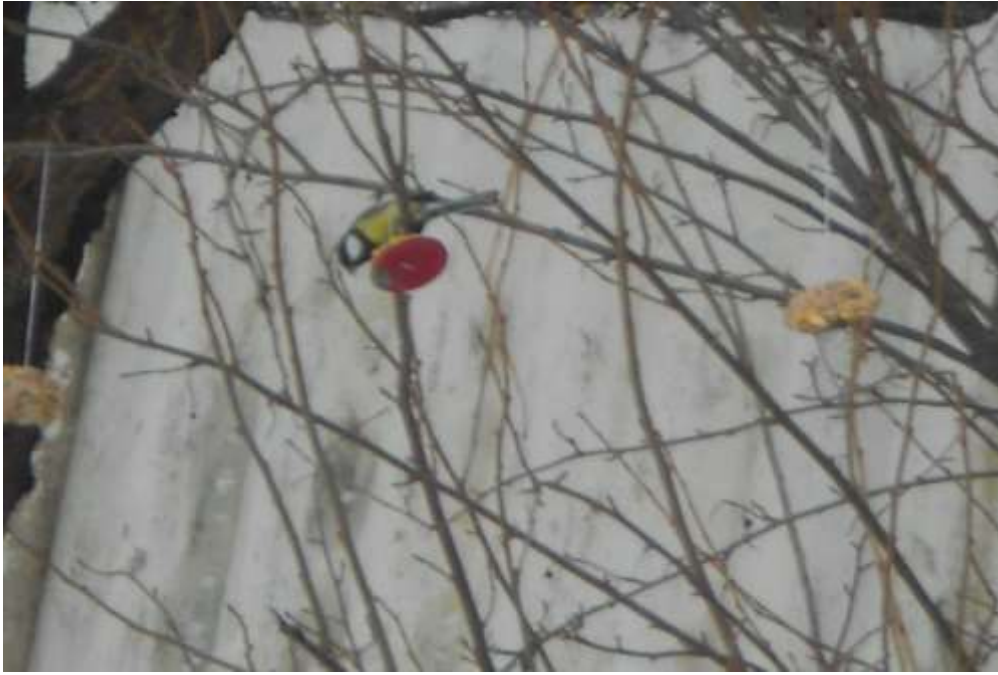
Первые гости в нашей «столовой».